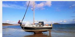
Le Phoque, bateau de la Compagnie des voiles.

Leur scène de théâtre est la plage, à marée basse... Et un bateau, le « Phoque ». Les cinq acteurs-matelots et musiciens de la Compagnie des voiles ont échoué leur bateau, mercredi soir, sur la plage de Kernevest, à Saint-Philibert. Ils attendent la nuit noire pour présenter, pour la première