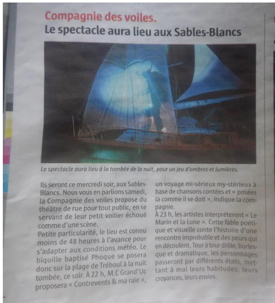
Le spectacle aura lieu à la tombée de la nuit, pour un jeu d'ombres et lumières.

Ils seront ce mercredi soir, aux Sables-Blancs. Nous vous en parlions samedi, la Compagnie des voiles propose du théâtre de rue pour tout public, en servant de leur petit voilier échoué comme d'une scène. Petite particularité, le lieu est connu moins de 48 heures à l'avance pour s'adapter aux conditions météo. Le biquille baptisé Phoque se posera donc sur la plage de Tréboul à la nuit tombée, ce soir. À 22 h, M.C Grand'Uc proposera « Contrevents & ma raie »,